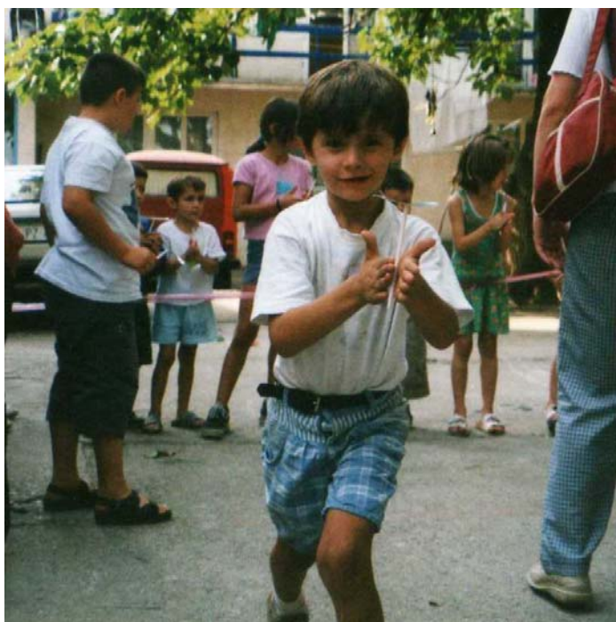
Photo : 2003 年 セルビアの難民キャンプにて